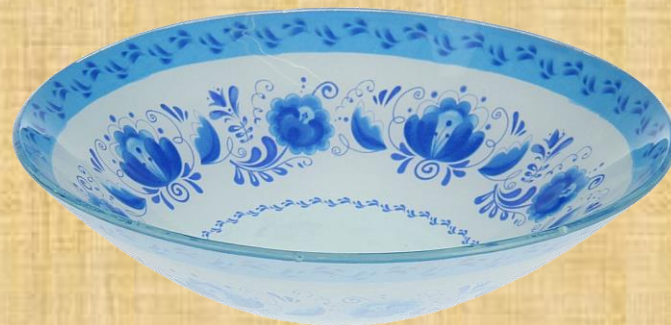
Тарелка глубокая суповая