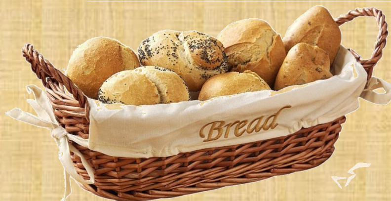
Корзинка для хлеба