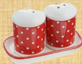
Солонка и перечница