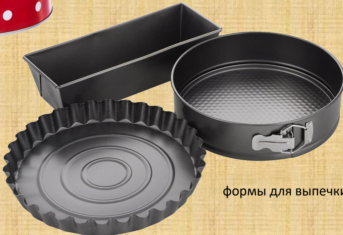
формы для выпечки