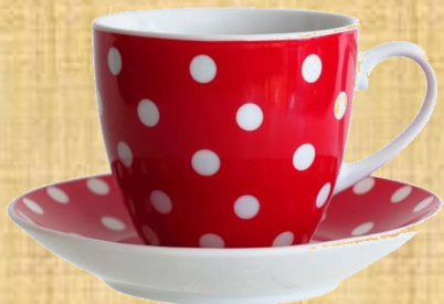
Чашка с блюдцем